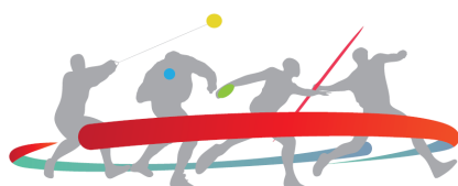
Torneio Internacional de Lançamentos Juventude Vidigalense

A 28ª edição do Torneio Internacional de Lançamentos voltou a ser mais um sucesso desportivo